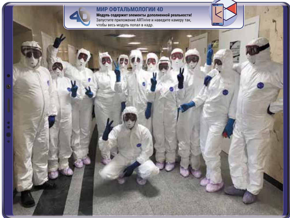
МИР ОФТАЛЬМОЛОГИИ 4D Модуль содержит элементы дополненной реальности! Запустите приложение ARTivive и наведите камеру так, чтобы весь модуль попал в кадр.