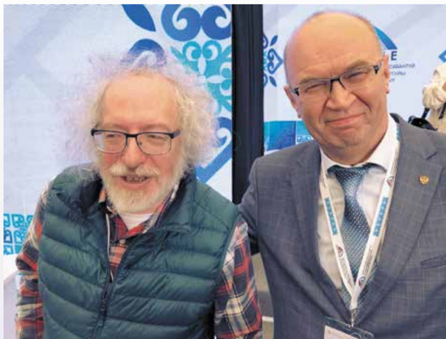
Р.З. Кадыров с главным редактором радиостанции «Эхо Москвы» Алексеем Венедиктовым

– Мое первое знакомство с офтальмологией произошло на 4-м курсе медицинского института, когда я устроился на работу медицинским братом в стационар нашего Уфимского научно-исследовательского института глазных болезней. Там я впервые увидел офтальмологические операции, которые возвращали зрение слепым людям. После этого были цикл лекций